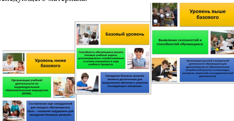
Рисунок 1.1 – Уровневый подход к оценке планируемых результатов ООП ООО

уровнем является достаточным для продолжения обучения и усвоения последующего материала.