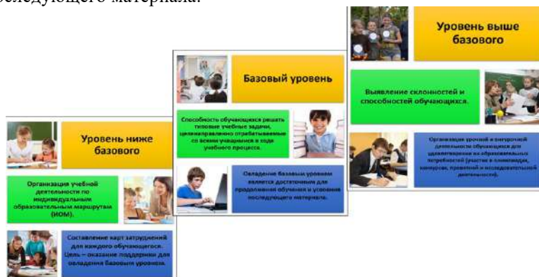
Рисунок 1.1 – Уровневый подход к оценке планируемых результатов ООП ООО

уровнем является достаточным для продолжения обучения и усвоения последующего материала.